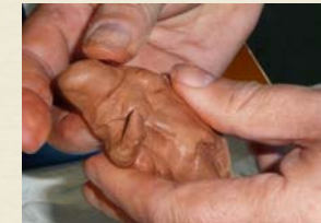
Émergence de la forme