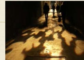
Sortir des ombres

Au cours de 5 jours (35 h) de formation nous apprendrons à nous centrer sur l'instant, sur la présence de soi (conscience du corps et/ou awareness) et de l'autre dans le champ relationnel. À travers des jeux de rôle s'appuyant sur la pratique de chacun, nous expérimentons le cycle du contact et le rôle de la frontière-contact dans la relation thérapeutique. À travers un parcours créatif explorer affect, sensation, sentiments, agressivité vitale. Nous évaluerons la nécessité d'organiser un cadre de fonctionnement.