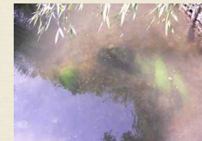
Collaboration des éléments en surface et en profondeur

Module de 2 jours (12 h). Intégrer les ressources de la Gestalt, du tarot, de la voix et de l'olfactothérapie à sa pratique. Augmenter la pertinence de mes interventions en établissant un cadre sécurisant pour les personnes. La question du groupe et la co-animation.